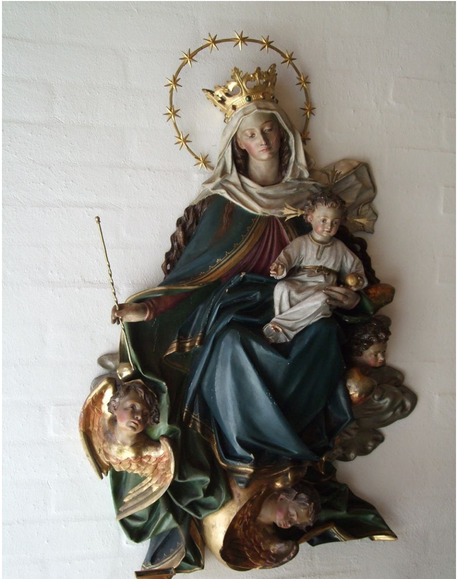
Fra Birgitta Klostret i Maribo.