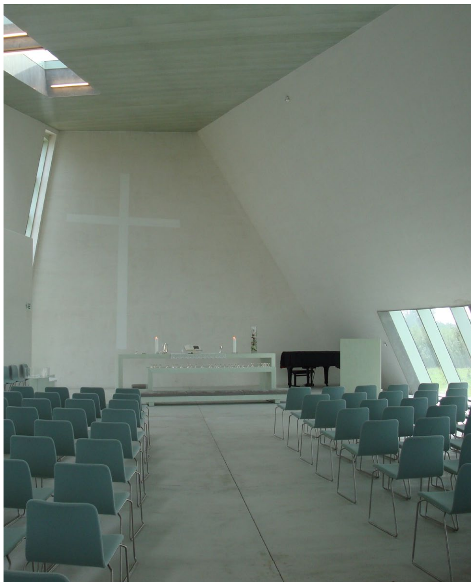
Hellig Kors Kirke i Jyllinge på Sjælland, bygget udelukkende af genbrugsplastmaterialer.