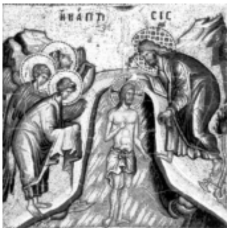
Jesu dåb fra russisk ikon fra det 14. årh.

er det. Men de kan ikke ud fra det slutte at noget er godt og noget ondt. Døden er for dem et biologisk faktum. Kroppen er sammensat, og derfor går den uundgåeligt i opløsning for til sidst at give plads til en