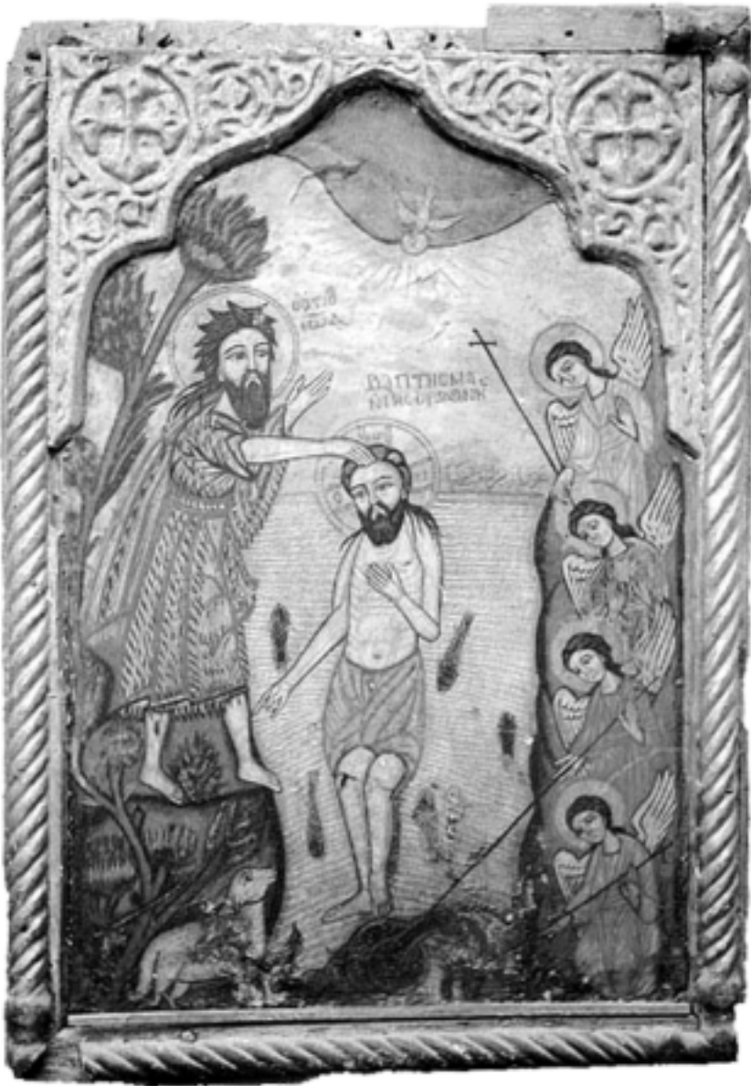
Dåben i Jordan er afbilledet i alle kirker, her i en skildring fra den koptiske kirke.