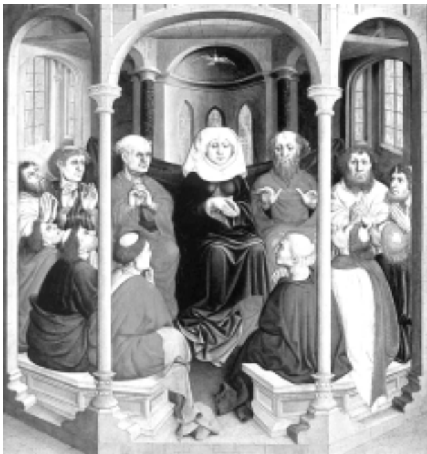
Pinsen fremstillet på Wurzach-alteret, malet af Hans Mutscher i 1437

I løbet af de sidste 40 år har forholdet mellem biskopperne, sogne-